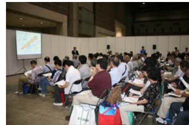
当社の会社説明会場