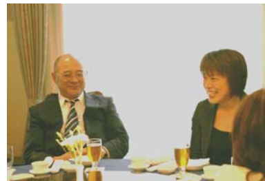
壮行会にて、寄岡社長に報告